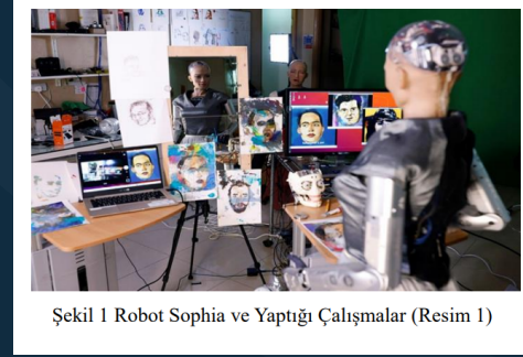
Şekil 1 Robot Sophia ve Yaptığı Çalışmalar (Resim 1)